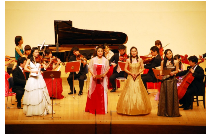
日本一早いニューイヤーコンサート