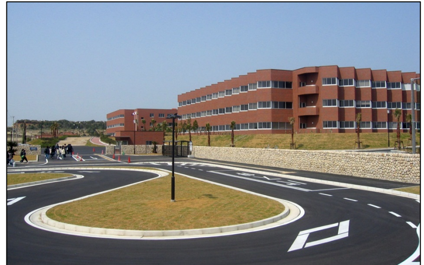
開学9年目を迎える千葉科学大学