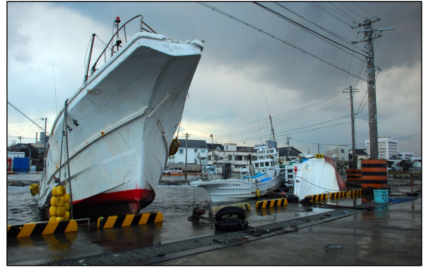
岸壁に乗り上げた漁船(中堤防付近)