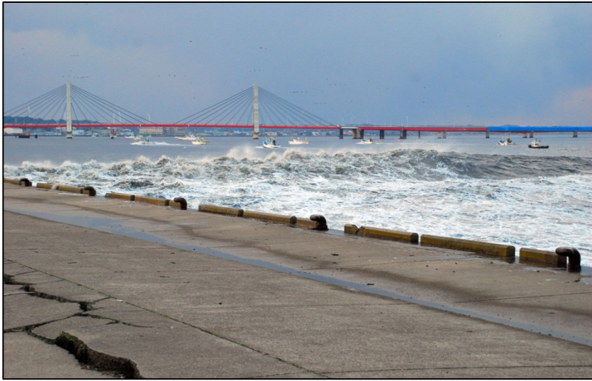
利根川をさかのぼる津波