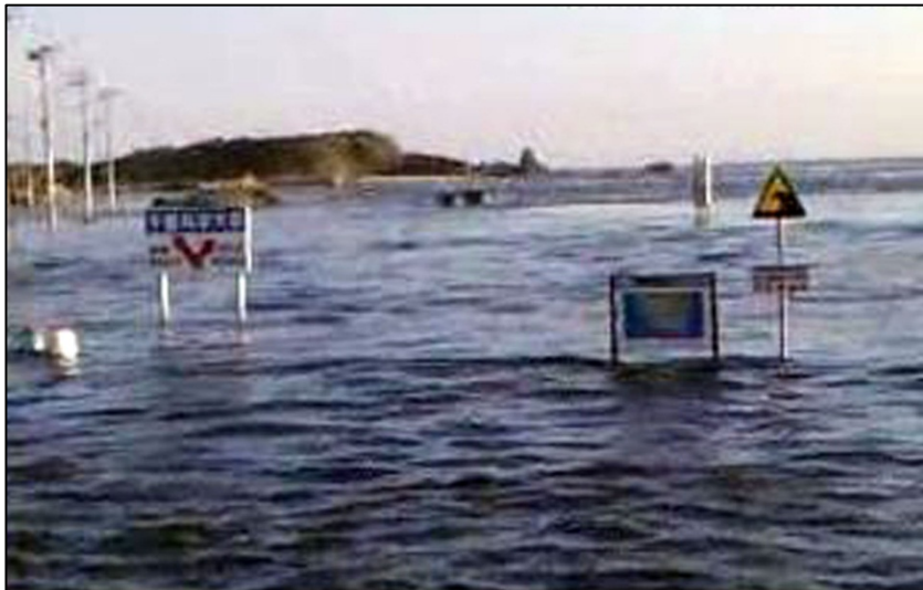
津波により浸水した潮見町地区