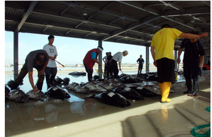
復旧した荷捌施設での水揚げの様子