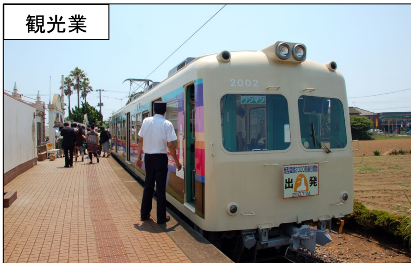
観光のシンボル 銚子電鉄