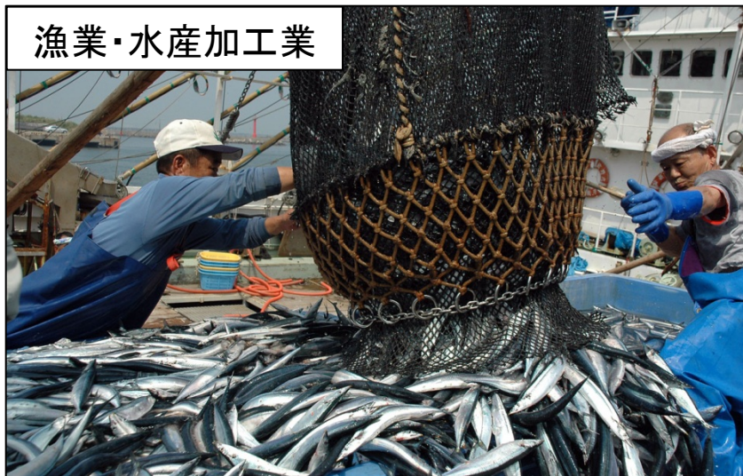
日本一の水揚げ量を誇る銚子漁港