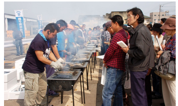
銚子の超おいしいサンマ祭り