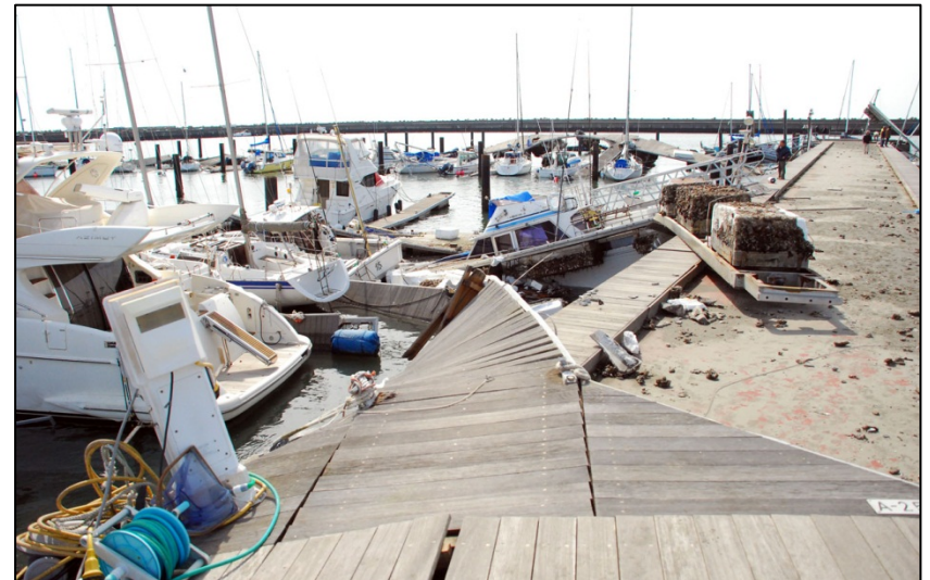
銚子マリーナは壊滅的な被害を受ける