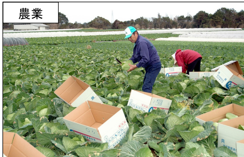
ブランド力の強い灯台印キャベツ