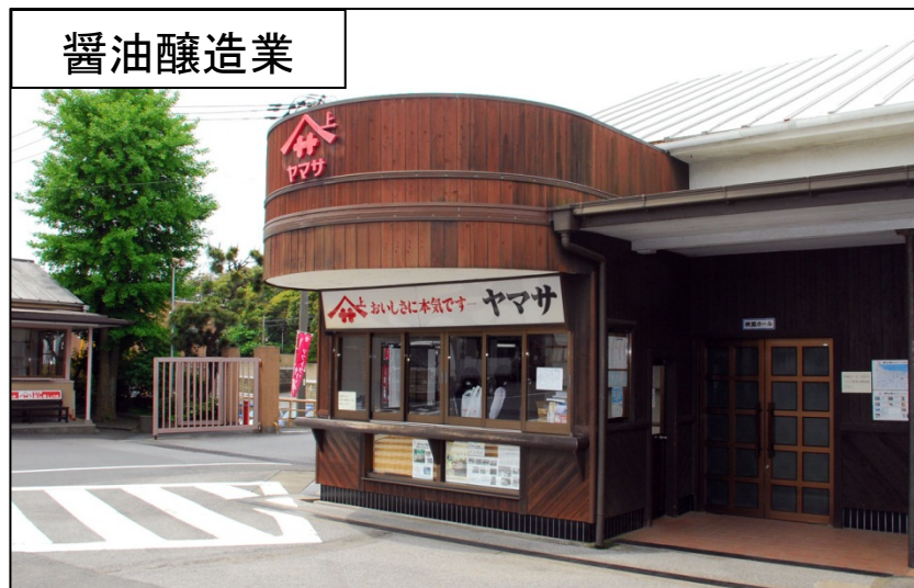
銚子は醤油醸造の最適地