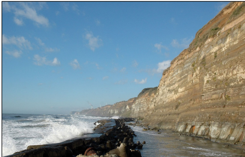
貴重な地質遺産を生かすジオパーク構想