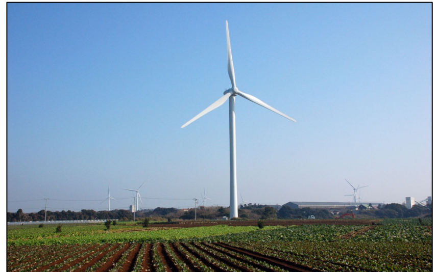
一年を通して風が強く、風力発電に最適