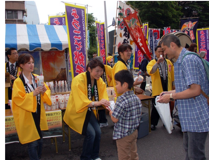
銚子の元気つたえ隊