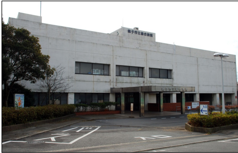
最優先課題である市立病院の再生